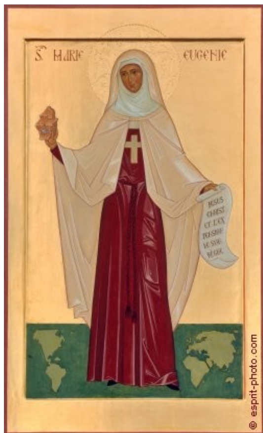
Imagen que se « descubrirá » el día de la canonización en la Plaza de San Pedro

El icono no es simplemente una obra artística, sino la representación de un personaje o de un misterio que se hace presente en forma espiritual. Rezando ante un icono, pintado según normas técnicas y teológicas específicas, podemos profundizar nuestro conocimiento del misterio de Cristo, de la Virgen, de los Santos... y entrar en contacto espiritual con ellos.